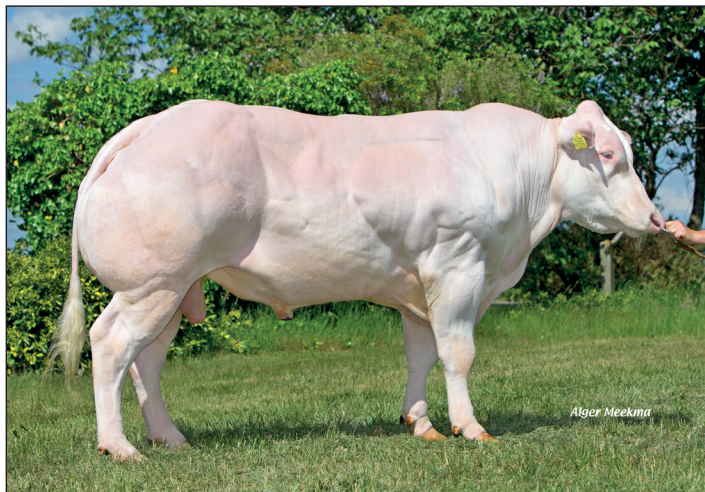
Stoevelaar Frits bevrucht +5 en geeft vlotte kalveren.

wordt nog relatief weinig Aberdeen Angus gebruikt. Hieronder de twee Angus stieren in het K.I. Kampen pakket.