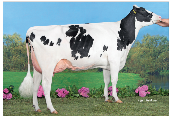
Overgrootmoeder Koepon Matteo, Esmonique 10, AB 85 Prod. o.a. 2.02 409 12.907 4.77 3.59 lw115+

Met Koepon Matteo hebben wij weer een nieuw talent op stal die opvalt door niet op te vallen. Hij is niet de grootste en laat mooi verhoudingen zien. Volgens zijn genomrapport mogen we rekenen op veel melk met behoud van gehalten.