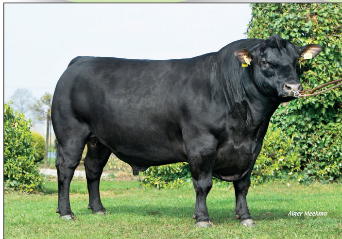
De Crob Conviction wordt ook in Nederland steeds populairder.