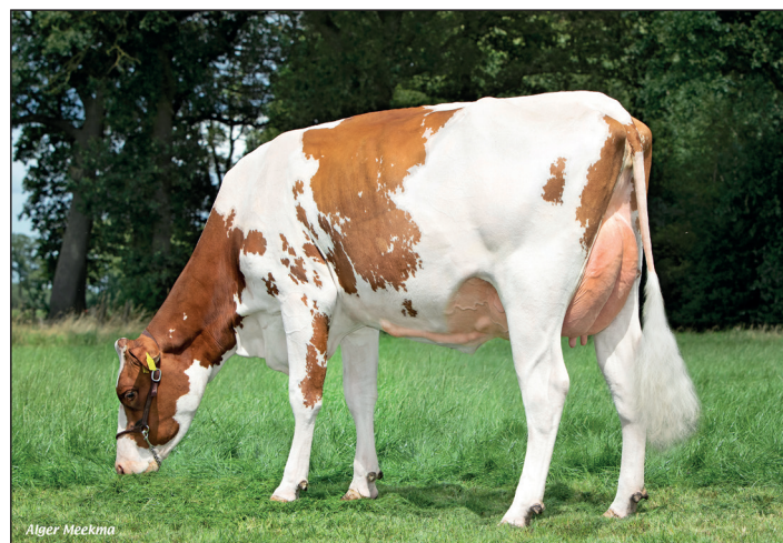
Toleandochter Groot Bromhaar Irene 148 heeft alles in zich om uit te groeien tot een beste melkkoel.

uiers. Daarnaast komt vaak terug dat het karakter van de Angelo's prima is om mee te werken. Voor de echte liefhebber zijn er nog enkele gesekste rietjes van Angelo beschikbaar.