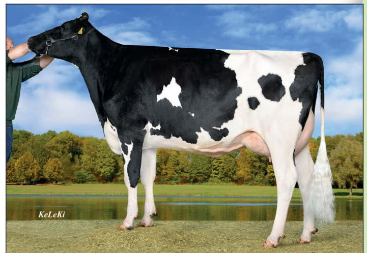
Grootmoeder Beerzedal HiPo Denzel, Thd Despasita, AB85 Gem. 3 lactaties 305 11.274 4.23 3.47