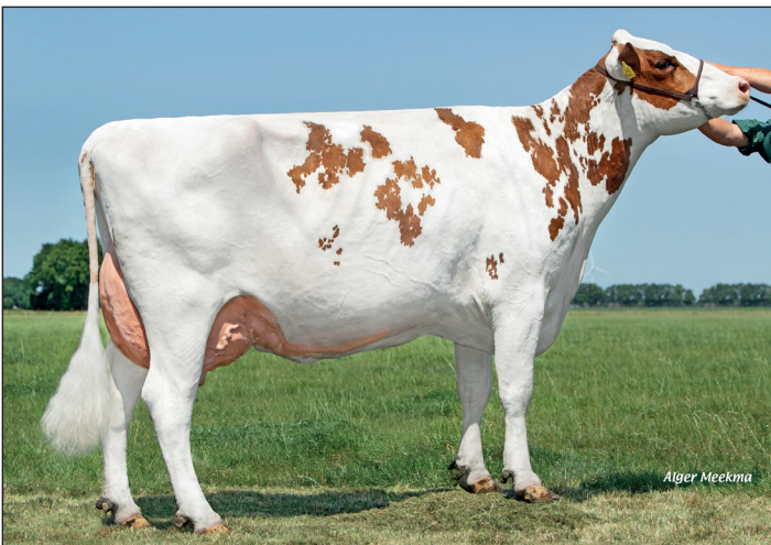
Grootmoeder Pepijn en Pascal Petra 4, AB87 Prod. o.a. 4.02 425 14.406 4.70 4.01 lw109

Meerdere stieren uit twee koefamilies waren de vorige stierenkaart erg populair. De vraag naar Wilskracht Worldcup (Taskforce P x Jaffa P, aAa 243, A2A2) was zo groot dat hij er bijna niet tegen kon dekken. Ook de vraag naar Wilskracht