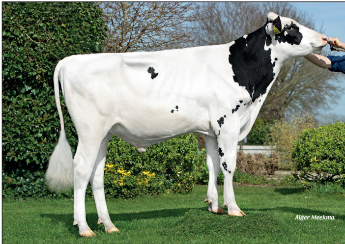
Beerzedal HiPo Denzel

Met Beerzedal HiPo Denzel test K.I. Kampen een vroege Holysmokeszoon. Zijn familie is bijzonder. Hij komt uit de Curr-Vale Goldwyn Delicious EX-94 familie. Een diepe Amerikaanse koefamilie waar o.a. ook de stieren Step Red, Destined Rf en Kodiak Pp uit voortkomen. Een nieuwe koefamilie voor K.I. Kampen, net als stiervader Holysmokes. Holysmokes is een Highjumpzoon uit een Renegade moeder en noteert enorm veel melk met vlot positieve gehalten. Op het exterieurgebied is hij geen extreme hoogvlieger. Sterke punten zijn vooral alle uieronderdelen. Verder zijn de gezondheidskenmerken uiergezondheid en vruchtbaarheid prima verzorgd en lijkt hij persistente dochters te geven.