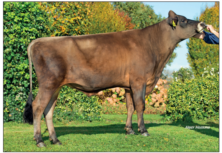
Siem komt uit een beste, laatrijpe koefamilie. Zijn dochters lijken zich best te ontwikkelen.