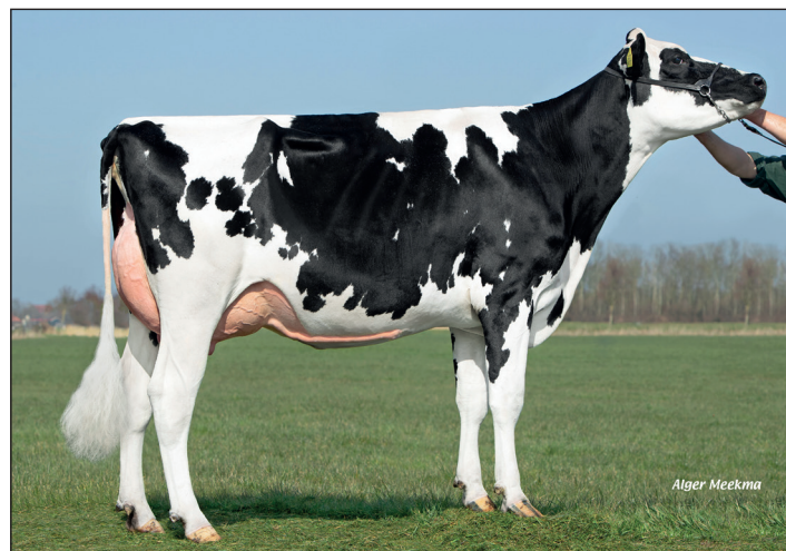
Caudumer Zalia 10, AB86 volle zus grootmoeder Jaring Rf

Als er iets duidelijk is geworden dan zijn het wel de hoge gehalten en het fraaie exterieur achter onze actiestier van april. Als bevestiging laat ook Jaring Rf zijn genoomprofiel zien dat wij te maken hebben met een stier die niet mag ontbreken op uw inseminatielijst.