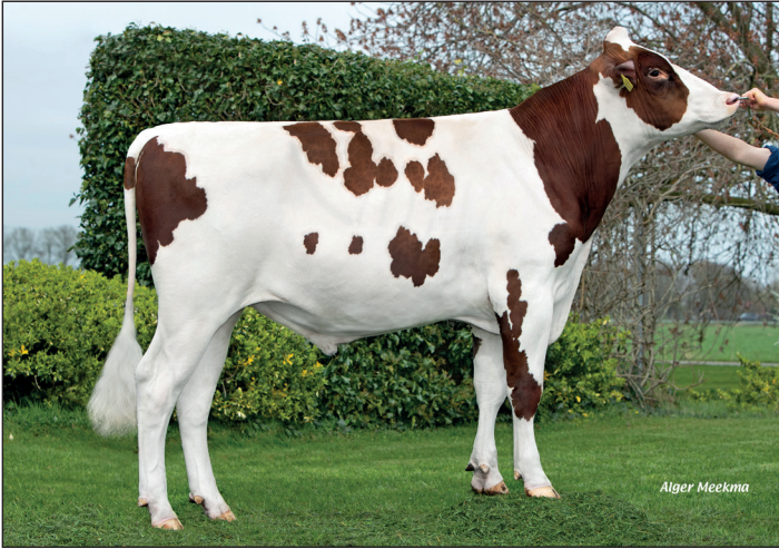
Wilskracht Wahoo P is in april nog actiestier

Meerdere stieren uit twee koefamilies waren de vorige stierenkaart erg populair. De vraag naar Wilskracht Worldcup (Taskforce P x Jaffa P, aAa 243, A2A2) was zo groot dat hij er bijna niet tegen kon dekken. Ook de vraag naar Wilskracht