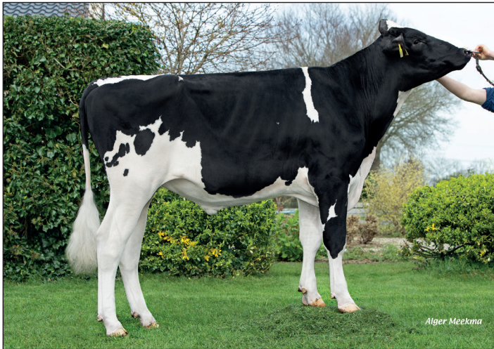
Brakels Blixt Rf

Succes wordt vaak bepaald door meerdere factoren. In foktechnisch opzicht wordt dit vooral bepaald door de combinatie tussen stiermoeder en stiervader. Juist deze combinatie is bij de actiestier van mei een belangrijk gegeven. Aan de vrouwelijke kant hebben we de fantastische Fridastam van de familie Swank uit Nieuw Beijerland en aan vaderszijde zien wij de stier Fair Play (Woody x Sunfit). Een combinatie die klopt als een bus. Stiervader Fair Play zorgt voor een flinke melkplas met neutrale gehalten en prima beenwerk. Vooral deze twee eigenschappen passen prima op de Fridastam. Ook voegt stiervader Fair Play veel toe aan de gezondheidskenmerken uiergezondheid en klauwgezondheid.