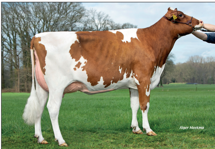
Timmer Torroxdochter Lomee 15

Prod.: 2.04 305 9.227 4.69 3.72 lw112+ vsp