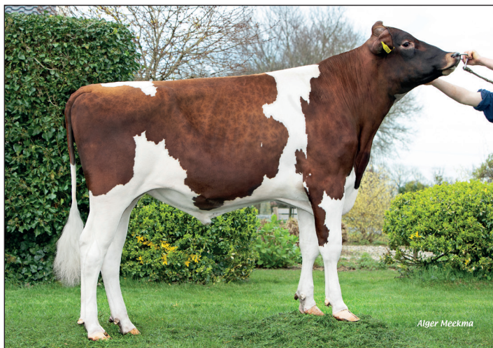
G. N. Editor P

G.N. Editor P is een stier die terugvoert op de legendarische Kamps Hollow Altitude. Zij was "Red Impact Cow of the Year 2009" en moeder van o.a. KHW Regiment Apple-Red EX-96 & vele bekende fokstieren. Het is een koefamilie die prima past bij het fokbeleid van K.I. Kampen. Productief en fraai gaan hierbij samen. Het laatste geldt ook voor stier vader Developer (Skippy x Esperanto). Hij is geen hoge melkververver maar weet met zijn torenhoge gehalten toch een hoge Inet te scoren. Daarnaast zijn het ruim ontwikkelde dieren die veel balans vertonen en fraaie uiers bezitten. De speenplaatsing is wat nauw maar dat past mooi op de familie achter G.N. Editor.