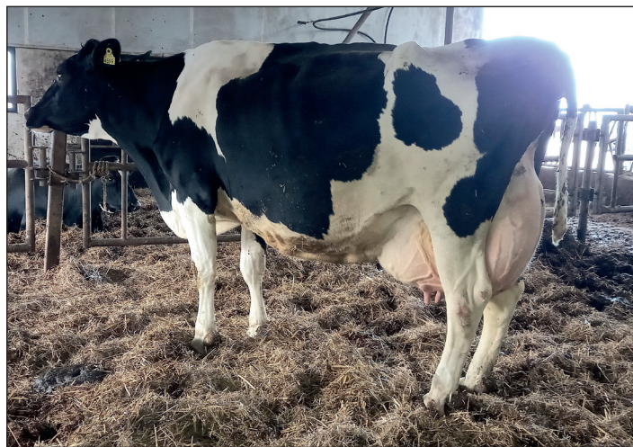
Deze Big Winner produceert indrukwekkend op Molkveebedrijf Terpstra-Gerbrandij. Levensproductie tot op heden: 3019 dgn. 130.074 kgm, 3.63% vet en 3.33% eiwit.