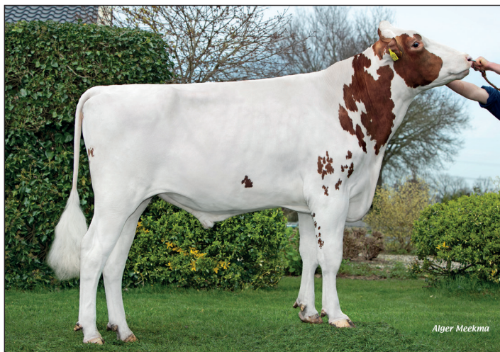
Poppe Kadans P

Veel zaken zijn in de huidige landbouw vastgelegd in de regelgeving. In de fokkerij kiest u gelukkig nog zelf. Diversiteit in het fokprogramma is belangrijk om aan uw vraag te voldoen. Met de inzet van Poppe Kadans test K.I. Kampen een stier die aantrekkelijk is voor veehoud(st)ers die een wat kleinere koe nastreven met hoge gezondheidskenmerken en torenhoge levensduurdagen. Om dit te realiseren is een fantastische koefamilie en stier vader belangrijk. Juist deze ingrediënten zijn prima verzorgd bij Poppe Kadans. Stier vader Cartoon P (Altatop x Handy P) is een allrounder. Zijn productieindex is prima opgebouwd en zijn onderbalk laat weinig fouten zien. Hoge scores hierin zien wij vooral terug bij klauwhoek, vooruieraanhechting en uierdiepte. Op gezondheidskenmerken scoort hij op alle fronten hoog wat bijdraagt aan zijn hoge score voor levensduur.