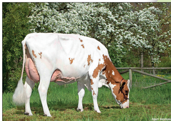
Moeder Poppe Kadans P, Poppe Kanu 1980, AB86 Prod.: 2.06 537 19.017 4.51 3.77 lw109

Voor Poppe Kadans lijkt een mooie toekomst weggelegd. Aan het uiterlijk van Kadans P ligt het niet. Hij is precies als zijn moeder, sterk gebouwd en voorzien van beste benen.