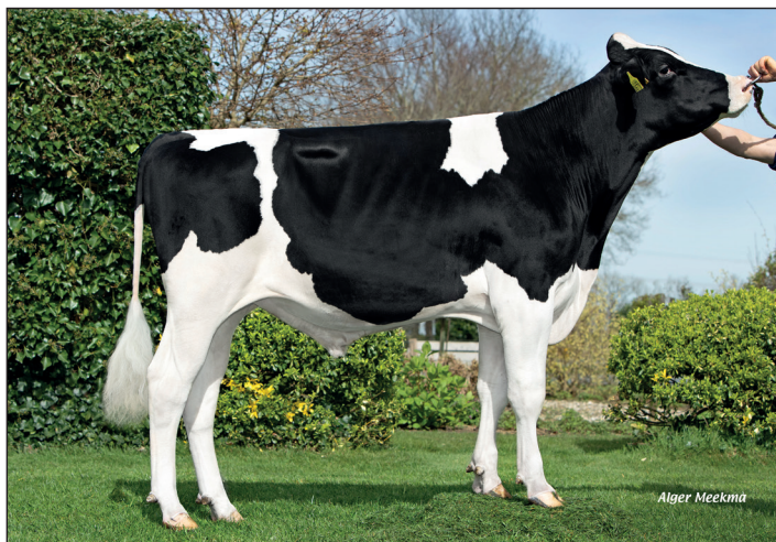
Caudumer Jaring Rf