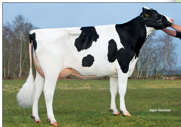
Overgrootmoeder G.N. Editor P, Altitude 1286, AB87 Productie o.a.: 6.03 433 16.711 4.25 3.54 lw120+

Balans is ook wat terugkomt bij de stier G.N. Editor P. Hij is evenredig gebouwd, heeft een diepe rib en is in het bezit van een breed kruis wat een perfecte ligging laat zien. Als bonus heeft G.N. Editor nog een P wat inhoudt dat de helft van de kalveren hoornloos worden geboren.