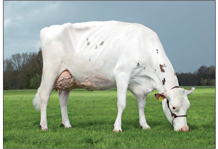
Worldcup en Wahoo P stammen uit de Warsi familie. Hun overgrootmoeder is Wilskracht Warsi 879 (A 93) Een koe die super productie en fraai exterieur perfect combineert.

Wahoo P (Cartoon P x Jaffa P, aAa 342) was groot. Om een ieder vlot te bedienen is de stier pas 1 april jl. als actiestier ingezet. Beide stieren hebben een geweldig profiel waarbij met name het vetgehalte positief opvalt. Bijna alle stieren uit deze familie zijn best in beengebbruik. Uit de Warsi lijn heeft K.I. Kampen meerdere stieren ingezet. Deze leveren tot nu toe uitstekende prestaties. Wilskracht Worldcup is tevens gesekst beschikbaar.