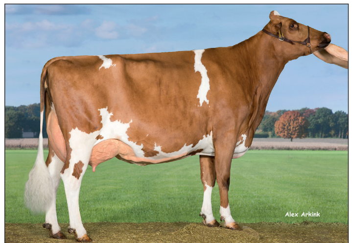
Betovergrootmoeder Biostee Vince, Frida 167, AB89 Levensproductie tot heden 2942 dgn 89.173 4.28 3.46

Wie de stier Biostee Vince in de stal van K.I. Kampen ziet rondlopen zal zeggen dat hij voldoende is ontwikkeld, een opvallende sterke bovenbouw heeft en stapt op beste benen. Vooral de blokken van klauwen vallen hierbij op.