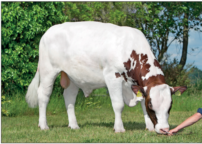
De Vinkenhof Powerboy is populair vanwege zijn beste bevruchting. Zijn eerste dochters zijn veelbelovend.