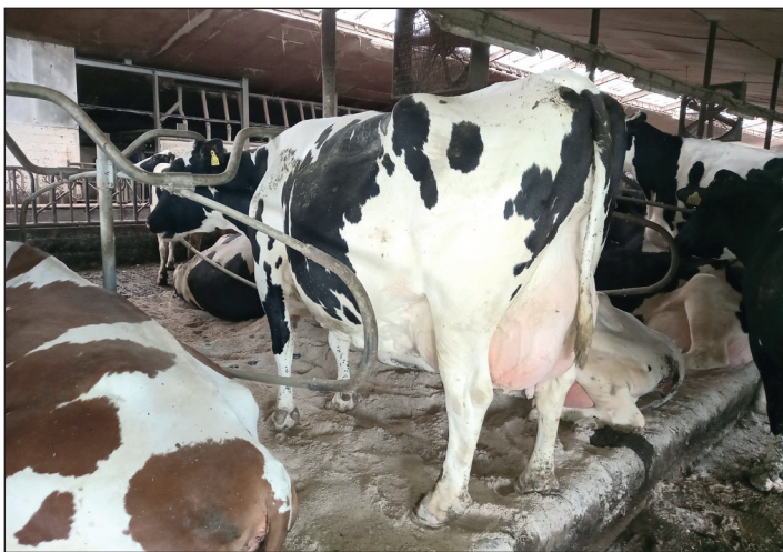
Deze vijfdekalfs Montreuxdochter is een echte Terpstra koe, breed van voren en een mooie conditie. Levensproductie tot heden: 1615 dgn. 51.618 kgm, 5.02% vet en 3.49% eiwit.

De koeien in Scharnegoutum krijgen een TMR rantsoen. Daarnaast krijgen ze brok bij in de 2 x 12 zij aan zij melkstal. De koeien komen niet buiten. "Koeien buiten is heel mooi, maar het weer in Nederland verandert te veel om constante kwaliteit te kunnen garanderen. Daarnaast is onze huiskavel klein." Zegt Pyter. Over de resultaten is Pyter erg tevreden. Het afgelopen boekjaar maakten de koeien gemiddeld 367 lactatie dagen. Daarin produceren ze 12.317 kg melk met 4.56% vet en 3.64% eiwit bij tweemaal daags melken. In de jongste generatie zit met name een stijging van de gehalten. "Ik selecteer stieren met plussen voor alle productiekenmerken. Een degelijke koe moet een goede productie aan kunnen en het blijven natuurlijk wel melkkoeien." De keuze wordt uiteindelijk afgemaakt door het KIK stieradvies. Dit is met name om te hoge inteelt te voorkomen.