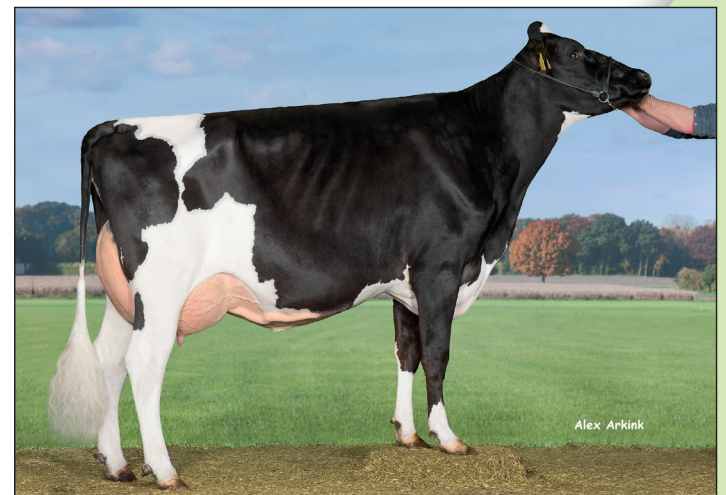
Overgrootmoeder Brakels Blixt Rf, Frida 199, B+84 Prod. o.a.: 2.03 339 9.568 4.70 3.55 lw112+

Brakels Blixt Rf is een correct gebouwde stier. Zijn genomfokwaarden laten zien dat hij het best gebruikt kan worden op een wat kleinere koe die even wat ondersteuning nodig heeft in kilogrammen melk en gehalten.