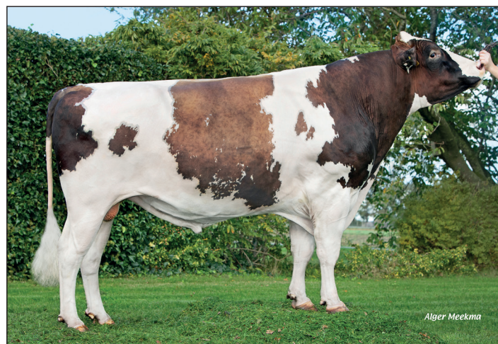
Groenibo Reliever kent veel tevreden gebruikers.